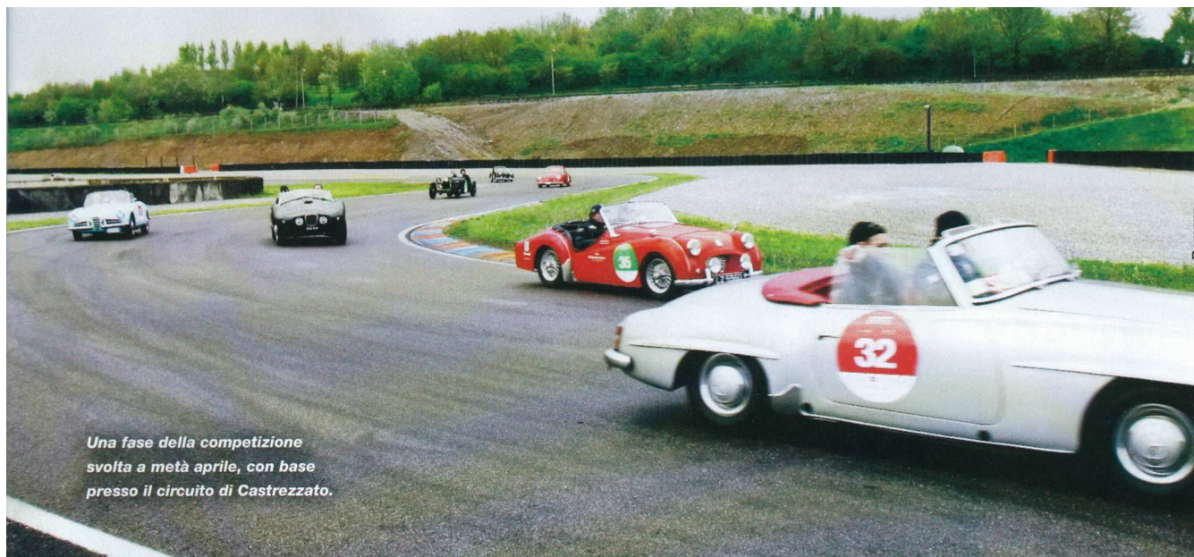
Una fase della competizione svolta a metà aprile, con base presso il circuito di Castrezzato.